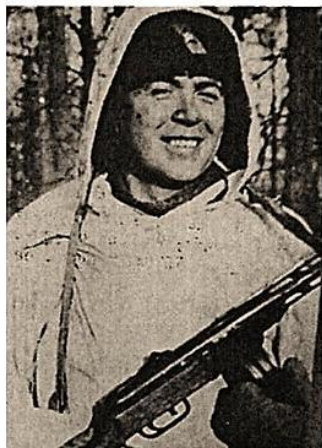
Партизан (1942 г.) и ветеран войны (1955 г.) Герой Советского Союза Иван Елисеевич